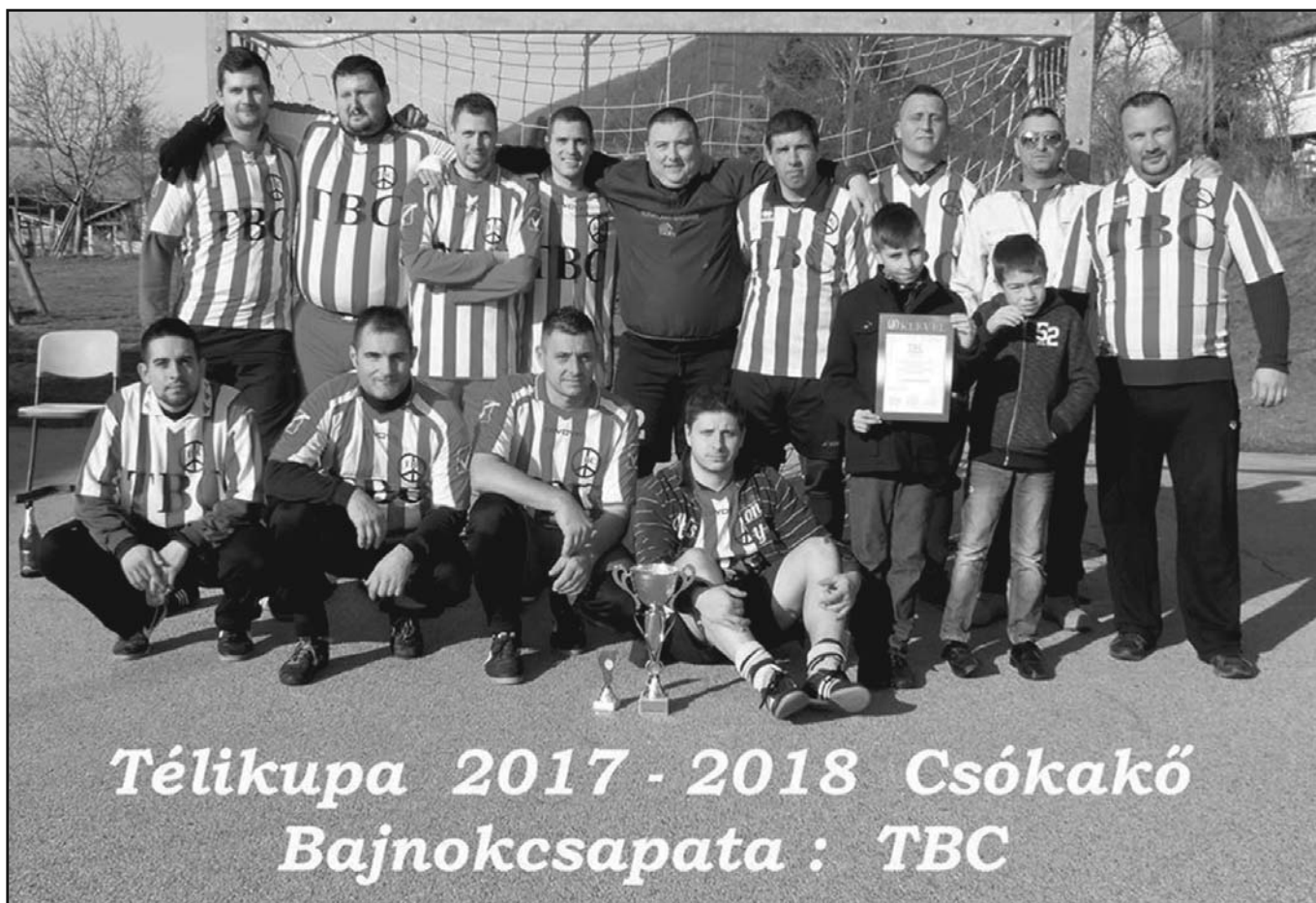
Télikupa 2017 - 2018 Csókakő Bajnokcsapata : TBC