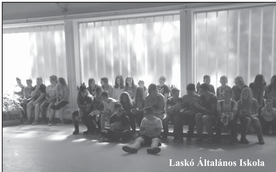
Laskó Általános Iskola