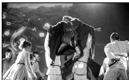
Részlet az idei Várjátékok alatt bemutatásra kerülő „Vazul Vére” történelmi rockopera előadásából

Magyarországon, mégpedig Keresztelő Szent János tiszteletére. A velencei papoknak megfájdult foguk a birtokaira és a kolostorra, így Szent Istvánt ellene hergelték, aki unokaöccsét, Csanádot küldte Ajtony elpusztítására 1028-ban. Csanád, akiről később püspökséget neveztek el, Ajtony fejét saját kezűleg levágta, nyelvét is kitepte. Ezeket a testrészeket bemutatta Szent Istvánnak, aki neki ajándékozta Ajtony birtokainak egy részét, más részét pedig az Ajtony által épített kolostorral együtt a velencei Gellért püspöknek. Ajtony udvar- és házanépét részint felkoncolták, részint szélnek eresztették. Helyükre olasz, velencei, német szolgahad és katonaság került. A mai történelem könyvek ezt Koppány felnégyelésével együtt úgy állítják be, mint a kereszténység szent harcát az istentelen pogányok ellen.