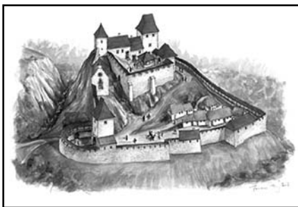
A csókakői vár (rekonstrukciós elképzelés, Ferenc Tamás grafikája)

Csókakő vára a XII. században épült. A Szulejmán által 1543-ban megostromolt várban napjainkban régészeti feltárások és helyreállítások folynak, az 1995-ben megalakult Csókakői Várbarátok Társaságának köszönhetően.