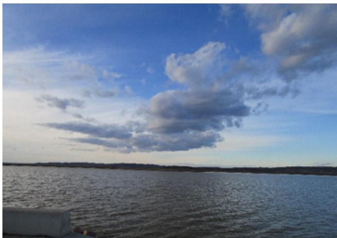
4. ábra A Velencei-tó decemberben