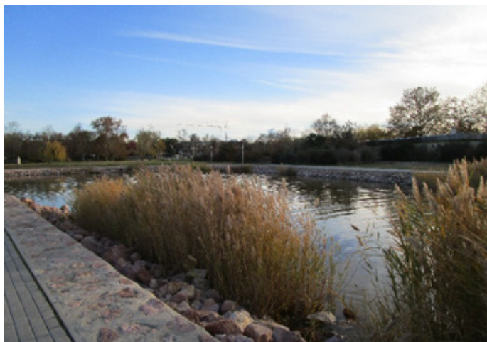
5. ábra A mesterséges szigeten