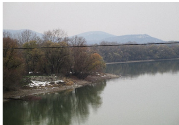
3. ábra A lecsendesedett Duna