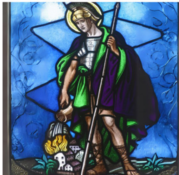
Szent Flórián, a tűzoltók védőszentjének ünnepe, a Tűzoltók Napja