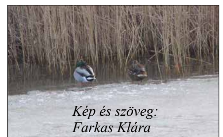
Kép és szöveg: Farkas Klára

Holnapra újabb jeget ígér a meteorológia: ónos esőt. Ez a víz egyik legrosszabb fajtája – legalábbis szerintem. Imádkozom, hogy megússzam kéz vagy lábtörés nélkül a következő napokat és ezt kívánom mindenkinek!